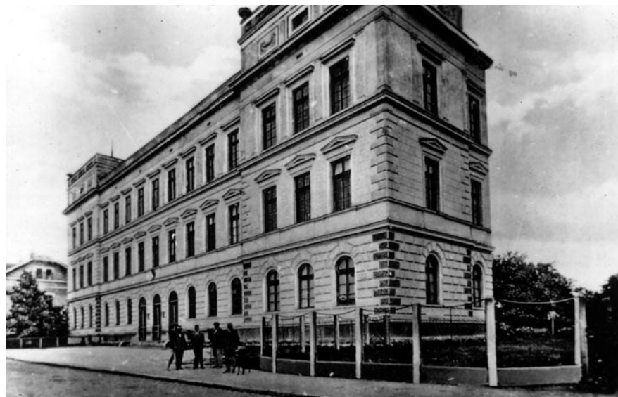
Зграда Реалне гимназије

у овом периоду Бања Лука је била средиште округа.